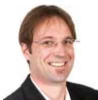
DPGKP Kai Mattersdorfer Psychosoziale Dienste, Gerontopsychiatrisches Zentrum, Wien